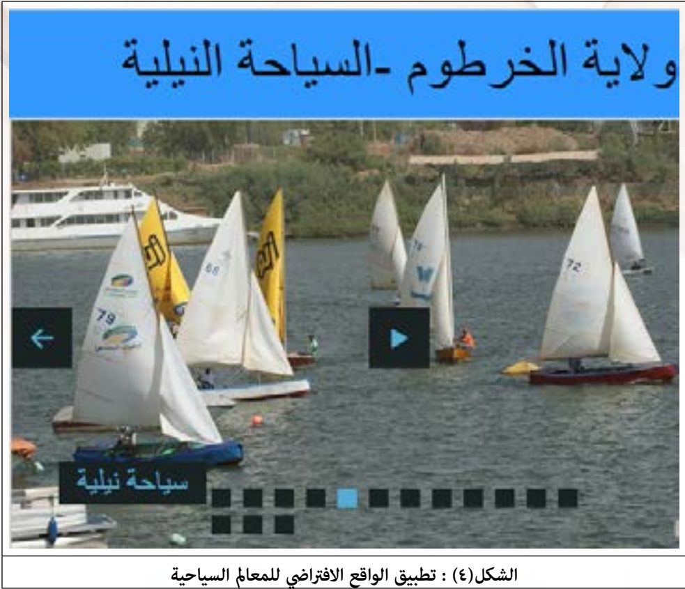
الشكل (٤) : تطبيق الواقع الافتراضي للمعالم السياحية

فمن الشكل أعلاه: نلاحظ الصفحة تمثل نموذج من النماذج التي تصميمها لتمثل الواقع الافتراضي للمقومات السياحية بولاية الخرطوم، كما تم تطوير تطبيق عبر مواقع الثقافة الالكترونية E-culture للسياحة بولاية الخرطوم، وفيه نلاحظ إمكانات مواقع الثقافة الالكترونية والتي تتمثل في الترويج والتسويق للمقومات السياحية بولاية الخرطوم. أيضا تم تطوير التطبيقات عبر التطبيقات الاحصائية السياحة بولاية الخرطوم وذلك بناء منهجية إحصائيات المنظمة العالمية للسياحة والتي تعتمد علي عدة متغيرات.