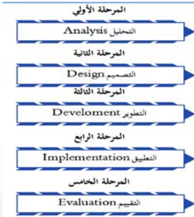
الشكل(1): منهجية تطوير التطبيقات

سوف نقوم بتطوير التطبيقات السياحية، وذلك من خلال تصميم مجموعة من التطبيقات متمثلة في تطبيق مكتبي، تطبيق الويب، تطبيق موبايل، تطبيق الواقع الافتراضي، تطبيق الاحصاء السياحي. فقد تم اختيار اسلوب دورة حياة تطوير النظام (System Development Life Circle - SDLC) في تحليل نظام المعلومات (1) الجغرافي لدعم القرار المكاني السياحي.