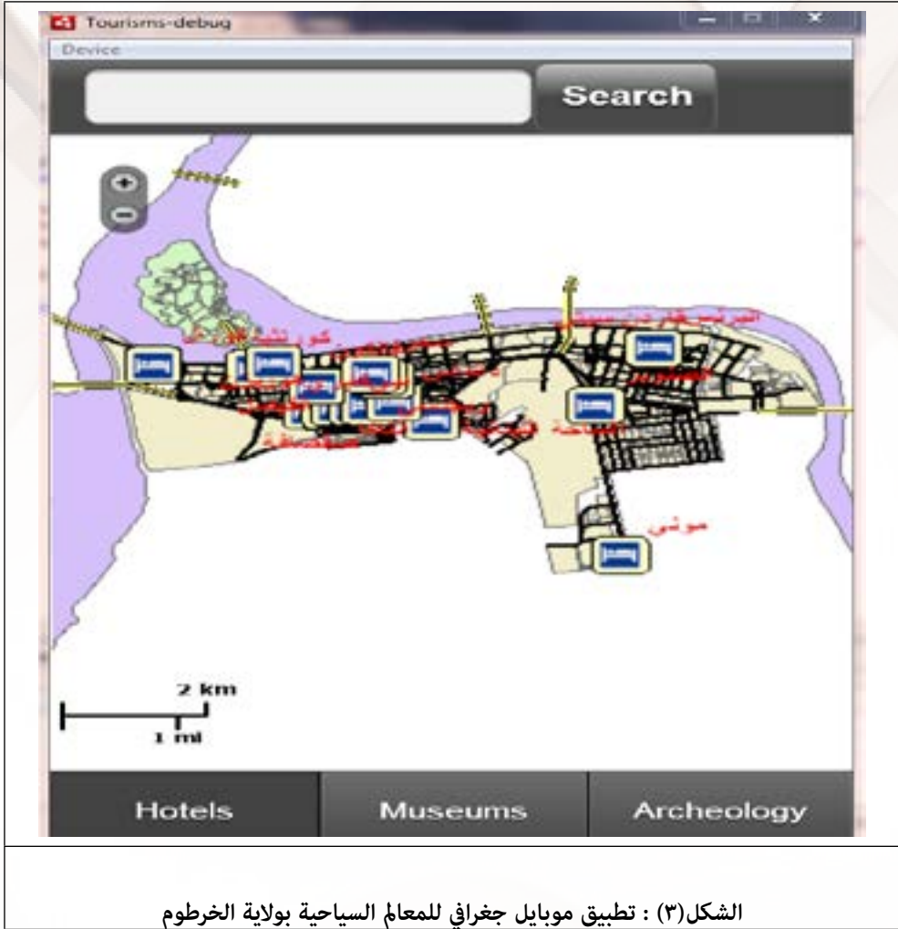
الشكل (٣) : تطبيق موبايل جغرافي للمعالم السياحية بولاية الخرطوم

حيث يمتاز التطبيق بإمكانيات التعامل به عبر الموبايل، حيث يمكن الاستفادة منه عبر جميع المستخدمين، ولكنه يمثل ركيزة للسائح والباحثين والطلاب بصورة أكثر. كما تم تطوير تطبيق عبر مواقع التواصل الاجتماعي للسياحة بولاية الخرطوم، والتي تتمثل في 5 مواقع رئيسية (الفيسبوك، تويتر، قوقل بلص، فليكر، يوتيوب)، الشكل أدناه يوضح علاماتها التجارية. حيث تمتاز هذه الصفحات بإمكانياتها في التعامل به عبر الانترنت، حيث يمكن الاستفادة منها عبر جميع المستخدمين، مع إمكانيات المشاركة والتفاعل.