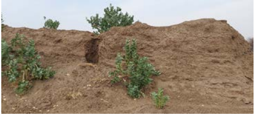
الصور (5-6) تعديت الأهالي على موقع الشارقة