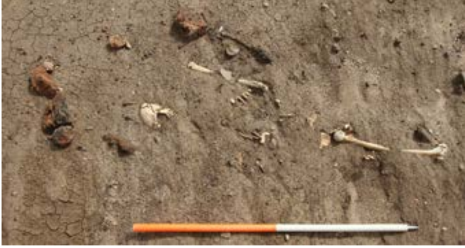
الصورة (13) توضح تأثير السيول والامطار على الموقع الأثري بسنار