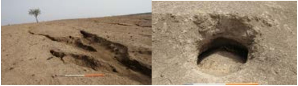
الصور (10-12) توضح تأثير السيول والامطار على الموقع الاثري بسنار