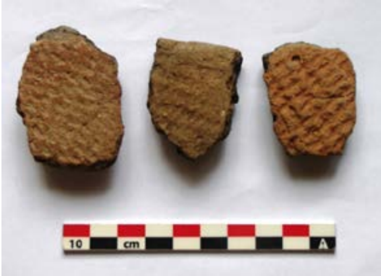
الصورة رقم (14) عينات من الفخار الذي يعود العصر الحجري الحديث من موقع